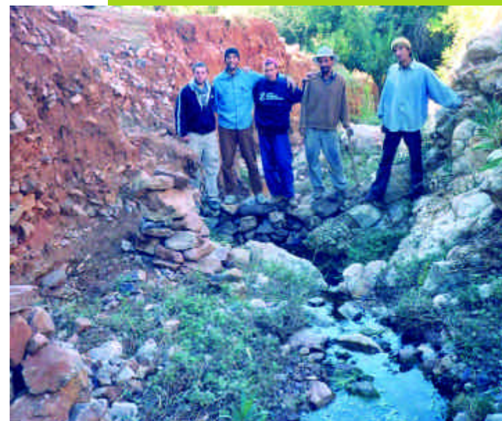
Grâce à l'AUI et à deux associations locales, un nouveau point d'eau a pu voir le jour sur ce site