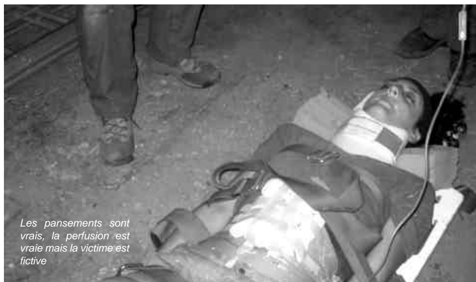
Les pansements sont vrais, la perfusion est vraie mais la victime est fictive

faire un choix. Concrètement il s'agit de faire tourner la direction d'un groupe autour d'une vie sociale où chacun a un rôle qui se définit par les nécessités du moment : faire à manger, nettoyer, organiser les interventions... Une nouvelle équipe volontaire et potentiellement utilisable, vient d'être formée. Bien sûr, il ne s'agit pas d'un état de fait ferme et définitif. Les techniques évoluent, nous perdrons sans doute avec le temps la gestuelle technique mais l'esprit de l'Action d'Urgence Internationale a été