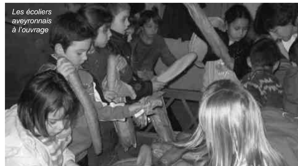
Les écoliers aveyronnais à l'ouvrage

enfants se sont initiés au conditionnement du pain. Ils ont écouté les réponses apportées à leurs questions, se montrant très intéressés par la démarche et, plus globalement, par tous les domaines qui touchent à l'humanitaire. Et ils n'ont pas non plus rechigné à mettre en pratique ce qu'ils ont entendu en distribuant des tracts et en apposant des panneaux d'informations sur le Pain de l'Espoir dans ce quartier de l'agglomération de Rodez. Le but recherché –sensibiliser les enfants à aider les personnes en situation critique et travailler au respect de l'autre- était atteint. Dans ce cadre, les Francas vont conduire différentes actions, notamment auprès des personnes âgées et handicapées.