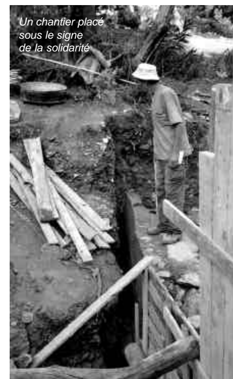
Un chantier placé sous le signe de la solidarité