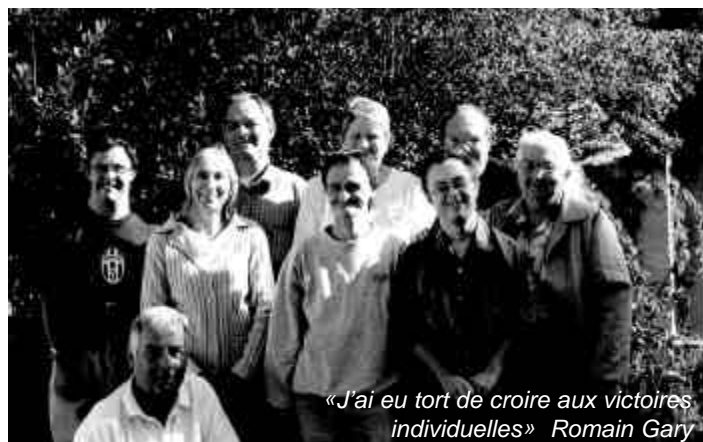
«J'ai eu tort de croire aux victoires individuelles» Romain Gary

choses que j'avais oublié, me sont revenues. Rassurer le blessé : pour moi, c'est parler avec lui. Pour eux c'est une autre dimension. C'est une caresse, c'est de la gentillesse avec un sentiment de «n'aie plus peur je suis avec toi». Ils m'ont désarçonné, mais ils m'ont remis en selle par leur