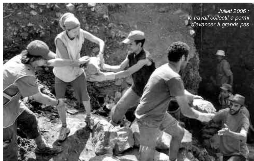
Juillet 2006 : le travail collectif a permis d'avancer à grands pas